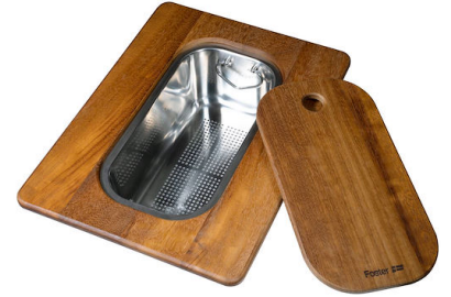
Planche de découpe Twin en bois Iroko avec tamis en acier inoxydable