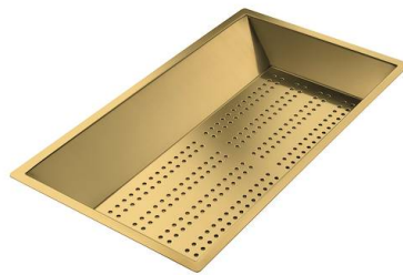
Cuvette perforée en acier inoxydable PVD Gold 8151 009 * uniquement en combinaison avec l'accessoire 8644 101